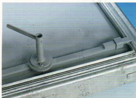
Tipul BV-GDZ Detaliile părții inferioare a închizătorului central