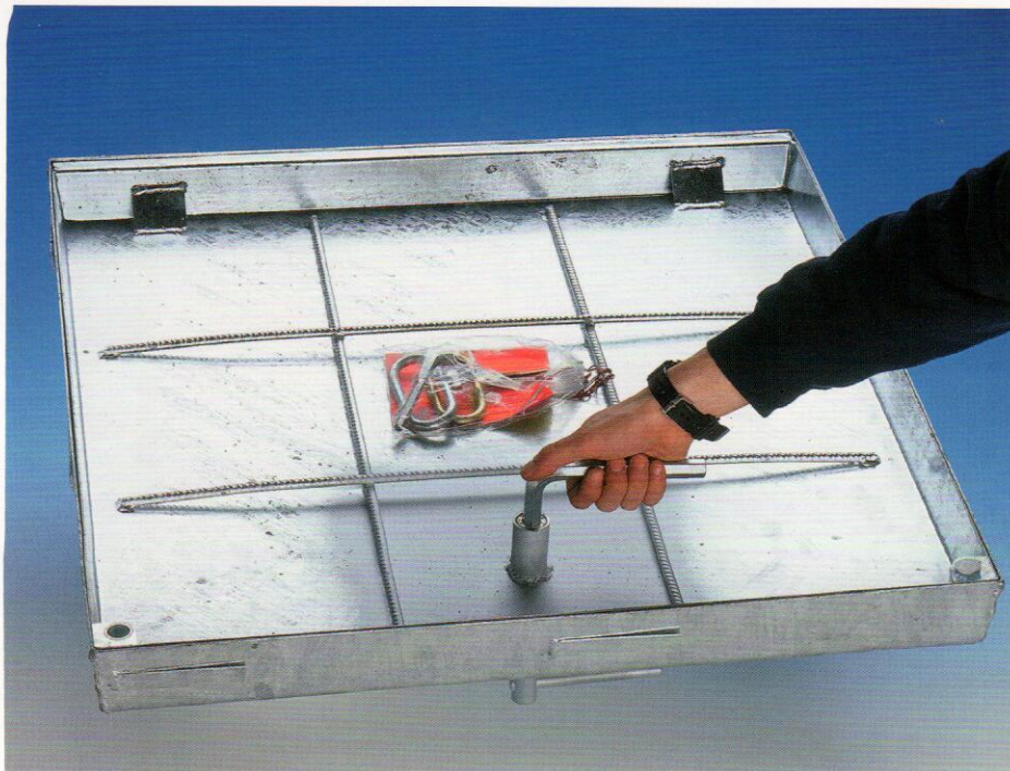
Tipul BV-GDZ Deschidere din partea de jos prin închizătorul central