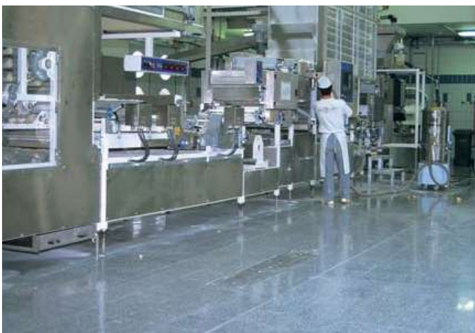
Tipul BVE Exemplu de utilizare în industria alimentară