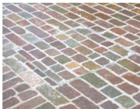
Tipul BVH-maxi umplut cu pietre de pavaj, invizibil