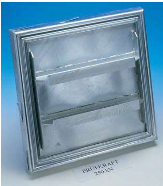
Tipul BVS-250 Partea inferioară a vanei rigidizată cu grinzi I și oțel plat